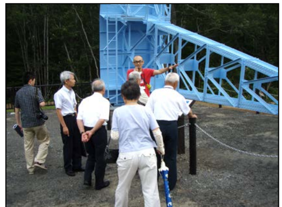
モニュメントの説明