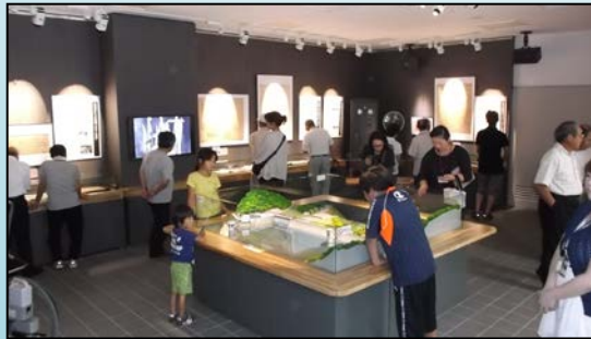
史料室の様子（子ども達は模型に興味津々でした！）