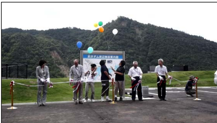
テープカットと風船揚げの様子