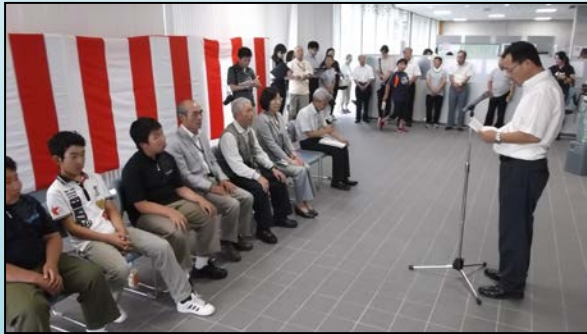
セレモニーの様子

石淵堰堤史料室は胆沢ダム管理支所（1F）にできた新しい展示スペースです。石淵ダムの歴史をビデオや年表などで知ることができ、建設当時の図面など貴重な資料が展示されています。また、史料室中央には精密に作られた石淵ダムの模型も展示されています。オープニングセレモニーでは除幕がうまくいかないハプニングもありましたが、終始和やかな雰囲気でのセレモニーとなりました。