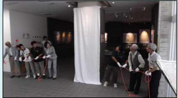
除幕の様子（紐を引張っても幕が取れませんでした（汗））