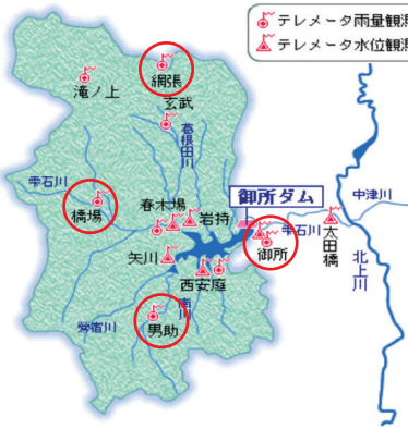
御所ダム気温 2021年02月