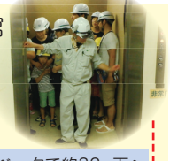
エレベータで約32m下へ