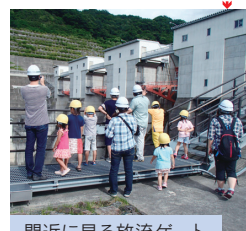
間近に見る放流ゲート