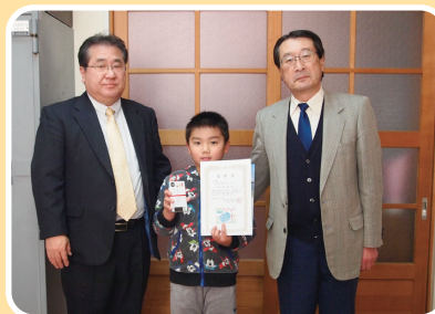
雫石町立橋場小学校