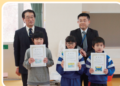
雫石町立七ツ森小学校