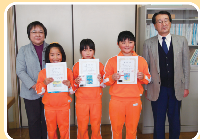
雫石町立御明神小学校