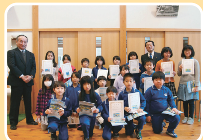
盛岡市立繫小学校