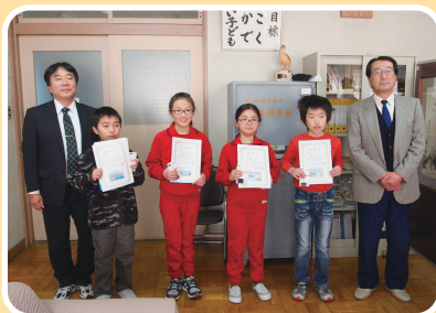
雫石町立雫石小学校