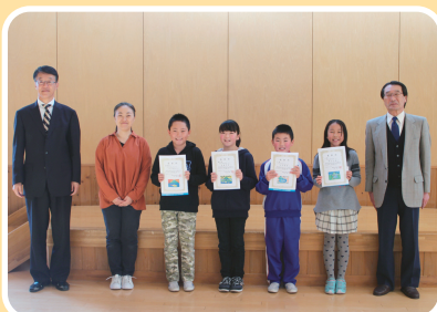
雫石町立御所小学校