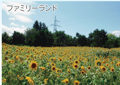
ファミリーランド