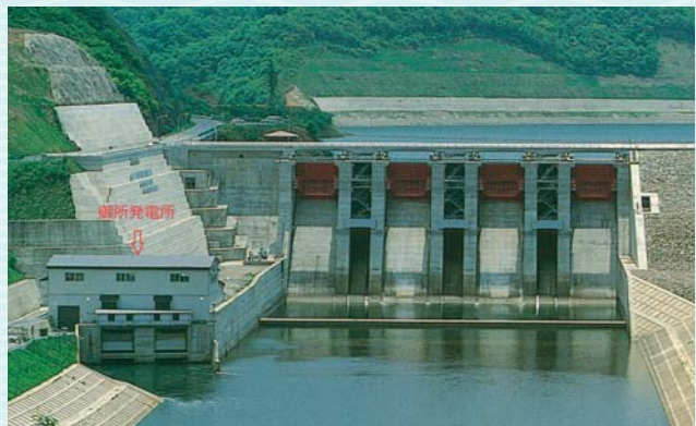
雫石川(御所ダム)の下流から見た御所発電所

岩手県企業局では、現在、御所発電所のほかに、岩洞第一・第二発電所、四十四田発電所など県内15箇所の水力発電所と1箇所の風力発電所において、自然エネルギーを利用した発電を行い、安定した電力の供給に努めています。