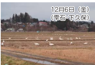
12月6日 (金) (雫石・下久保)