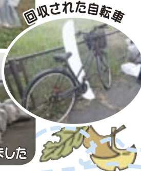
回収された自転車

毎年この時期に開催される『秋の御所湖周辺統一清掃』が10月14日(日)に御所湖周辺を会場に開催されました。当日は、まだ薄暗い内から開始時刻の午前6時30分までに清掃に参加する大勢の方々が主会場となっているシオン像前に集まり開会式を行いました。今回の秋の統一清掃では昨年より約150名多い総勢750名の参加者により御所湖周辺の清掃活動を実施しました。下のグラフのように参加人数は増加傾向にあり、地域の方々及び関係団体の環境保全の意識の高さを改めて感じています。