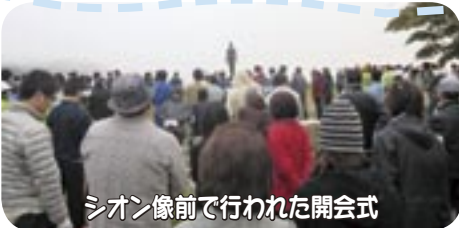
シオン像前で行われた開会式