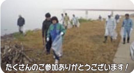
たくさんのご参加ありがとうございます!