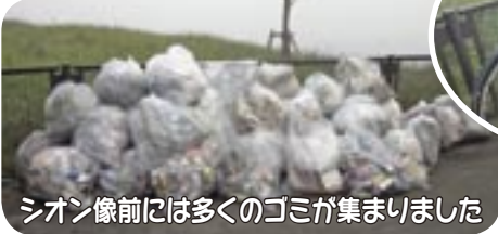
シオン像前には多くのゴミが集まりました