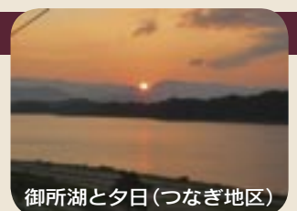
御所湖と夕日(つなぎ地区)