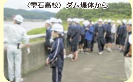
〈雫石高校〉ダム堤体から