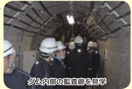
ダム内部の監査廊を見学

9月24日(月)には雫石高校の1学年の皆さんが見学へ訪れ、ダムの仕組みや役割等を学習し、その後は監査廊(ダムの内部)の見学を行いました。続く9月25日(火)には、安庭小学校6学年の児童が見学へ訪れ、ダムについての学習の後、管理庁舎屋上からダム全体を見学しました。また、9月28日(金)には、厨川小学校・大新小学校の児童の皆さんがものしり館・防災センターを訪れ、熱心にメモをとるなどし、ダムに関して理解を深めていました。