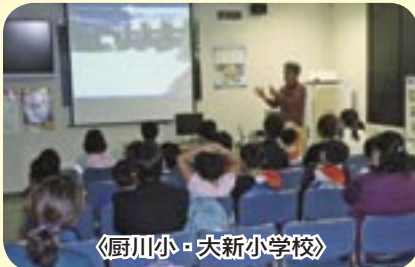
〈厨川小・大新小学校〉