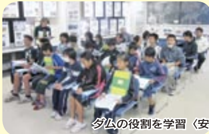
ダムの役割を学習 〈安庭小学校〉管理庁舎屋