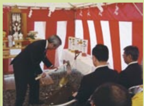
盛岡広域振興局土木部 道路佐藤河川室長による鍬入