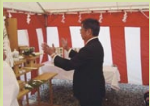
町場地区行政区長による玉串奉奠