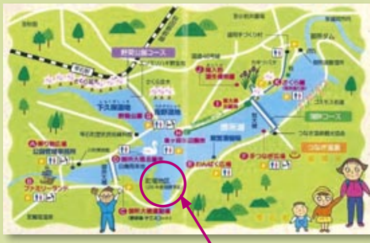
町場地区園地 (平成25年開園予定)