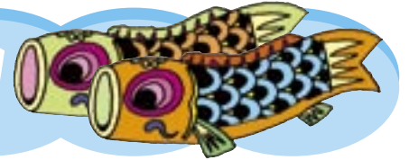
雫石川を泳ぐ鯉のぼり