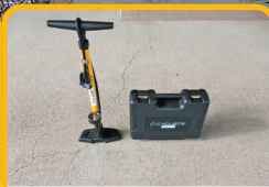
空気入れ&工具を貸し出し