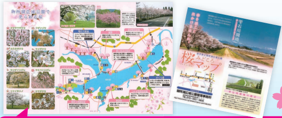
↑御所湖周辺の「桜みどころマップ」(岩手県御所湖広域公園)も配布中。