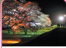
R5年4月 雫石川園地の桜ライトアップ