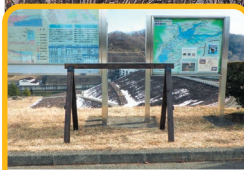
サイクルラック (※冬期間は設置しておりませんのでご注意ください)

「ごしょこものしり館・防災センター」は盛岡市繫の御所ダムの管理庁舎に併設されています。