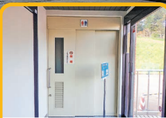
トイレや休憩場所も完備

岩手県では自転車利用者へ提供するサービスの充実を図り、自転車を活用した観光振興等を促進するため、サイクルラックなどの自転車利用環境が整っている施設等を『いわてサイクルステーション』として登録しています。