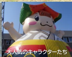
大人気のキャラクターたち