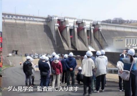
ダム見学会 監査廊に入ります