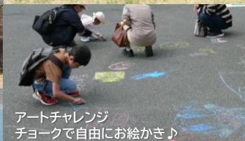
アートチャレンジ チョークで自由にお絵かき♪