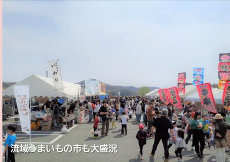
流域うまいもの市も大盛況

R6.4.14(日)、四十四田ダムさくらまつり2024が開催されました。約5000人と沢山の方にご来場いただき、盛況のうちに終了しました。ご来場ならびにご協力いただいたみなさま、ありがとうございました！