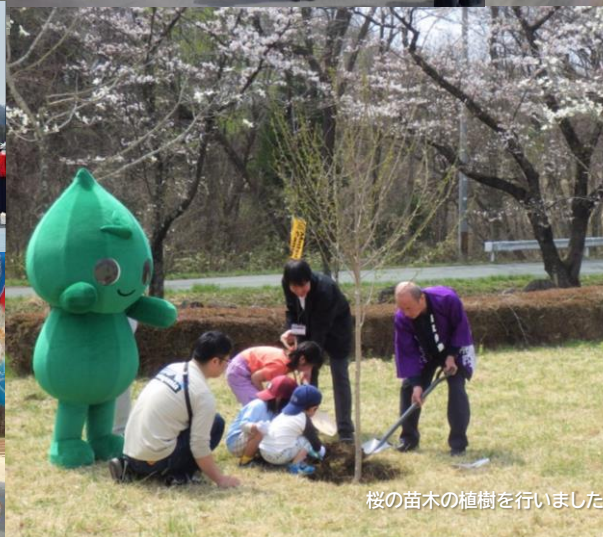
桜の苗木の植樹を行いました