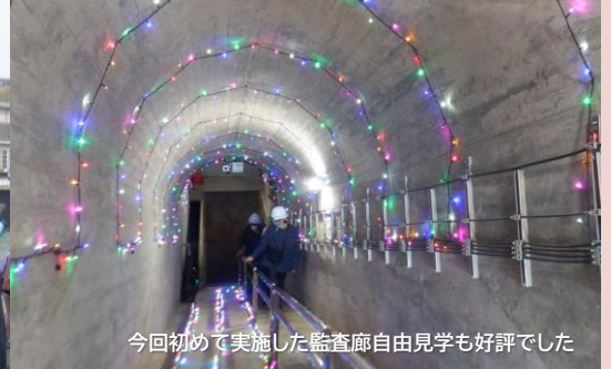
今回初めて実施した監査廊自由見学も好評でした