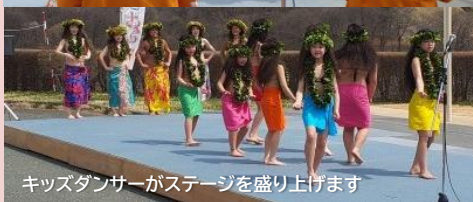
キッズダンサーがステージを盛り上げます