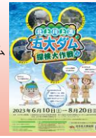
④ 岩手県立博物館 との合同テーマ展 「北上川上流五大ダム 探検大作戦」