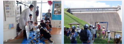
⑥ 岩手県立博物館合同テーマ展コラボイベントを開催 バックヤードツアーやダムのしごとたいけんなど、普段見られない 場所を見学したり、ダムで働く人たちのしごとを体験したりして いただきました。