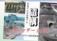
⑧ 2018年から毎年作成 している「ダムカレンダー」。 2024年版は、5大ダム & 石淵ダムの遺構をテーマ に作成。