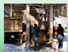
⑨ 毎年、一年の始まりに 御堂観音で無事故・無災害 を祈願しています。