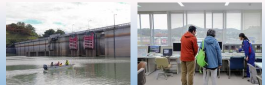
⑦ 四十四田オー“ダム”まつり2023 2回目の秋のまつりの開催。家族連れやダム愛好家のみなさんなど、 多くの方にお越しいただき、ダムを楽しく学んでいただきました。