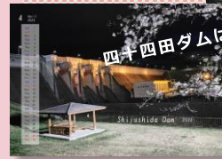
「4月」は堤体照明点検を兼ねて 行われたダムライトアップの様子。 夜桜とダムの幻想的な共演です。