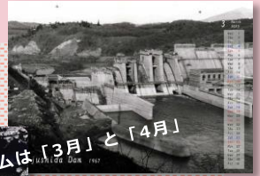
「3月」は建設中の写真。 堤体のコンクリート部が建ち あがっていくところです。

北上川五大ダムの「ダムカレンダー2023」が完成しました！ 今回は、「5ダム今昔カレンダー」をテーマに、現在のダムと、 今は見ることができない建設中の写真を厳選して使用しています。 ぜひホームページからダウンロードしてみてくださいね。 「ダムカレンダー」は2018年から毎年作成しており、各ダム が厳選した写真を使用しています。