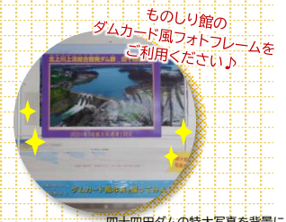
四十四田ダムの特大写真を背景に 記念写真を撮ってみてね！