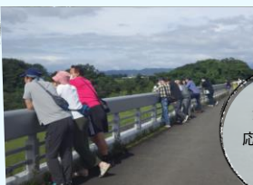
ガンライザーも 応援にかけつけて くれたよ