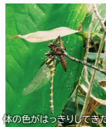
体の色がはっきりしてきた