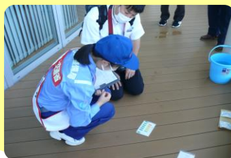
ダム湖の水質検査