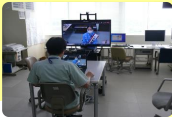
TV会議で今日のスケジュールを確認