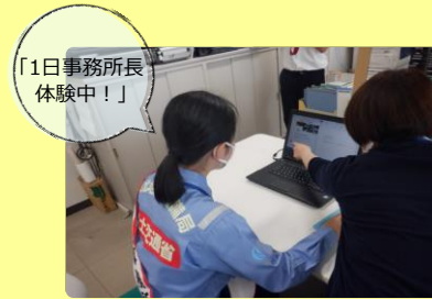
ダムの広報活動 Twitterを投稿