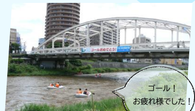
ゴール! お疲れ様でした!