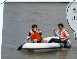
当事務所からの 出場者も大健闘 しました!