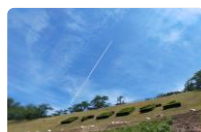
7月某日 四十四田公園上にのびるひこうき雲

3年ぶりに「北上川ゴムボート川下り大会」が無事に開催されて本当に良かったですね。出場のみなさん、関係者のみなさん、暑い中大変お疲れ様でした！北上川から見る盛岡の景色はいかがだったでしょうか。来年も無事に開催されますように。(田)