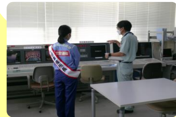
四十四田ダム操作室での模擬操作