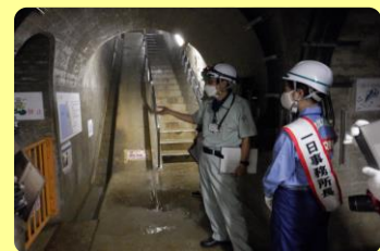
ダム天端通路やダム内部の監査廊で施設の点検