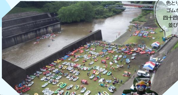
色とりどりの ゴムボートが 四十四田ダムに 並びました