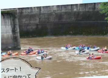
スタート! ゴールに向かって 一斉に漕ぎ出します

388艇776人が参加。午前9時から10分おきに30艇ずつスタートしゴールを目指しました。前日の雨で開催できるか心配されましたが、当日は雨もあがり、スタート地点の四十四田ダムは、出場者や応援の方で賑わいました。