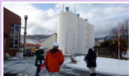
炭酸カルシウムを貯蔵する設備