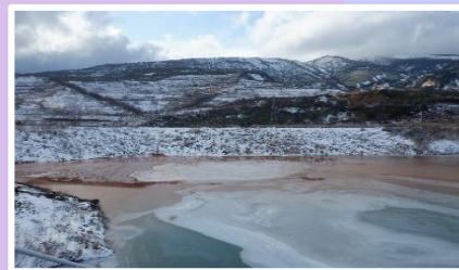
中和反応によって発生した中和副物を堆積するための貯泥池