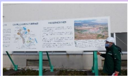
施設の概要を説明していただきました