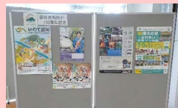
ものしり館に入って右側に掲示しています

盛岡市は今年、市制施行130周年です。ものしり館でも、盛岡市のイベントなどに関するポスターを掲示し、盛岡市の事業についてお知らせしています。随時、追加しながら更新していきますので、ものしり館にお立ち寄りの際は、ぜひこちらの展示もチェックして下さいね。