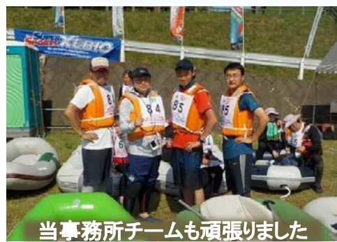
当事務所チームも頑張りました