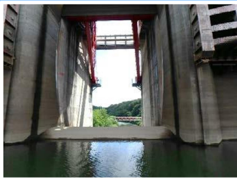
クレストゲート全開です

7月～9月は「洪水期」と呼ばれる1年の中で最もダム水位が低くなる時期です。この時期を利用してダム最頂部にあるクレストゲートの保守点検を行いました。