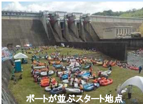
ボートが並ぶスタート地点