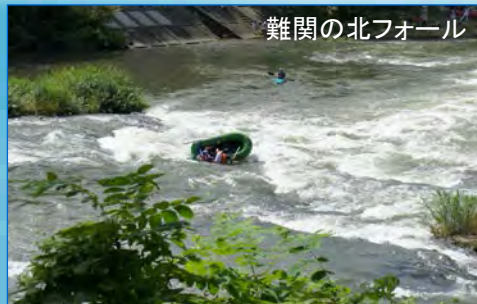
難関の北フォール