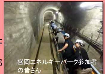
盛岡エネルギーパーク参加者の皆さん

7月1日(金)もりおかエネルギーパークの一環として、四十四田ダム見学がありました。再生エネルギーを利用した施設を見学し、皆さんに環境について考えていただくという盛岡市の企画です。今回は四十四田ダムに、16名の参加者が訪れました。ダム内部を見学し、水力発電との関わりについて学ばれました。