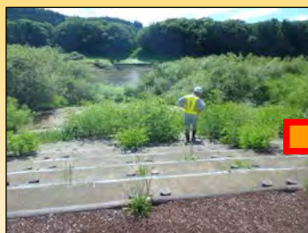
水辺の階段に樹木繁茂し、危険

7月8日(金)、安全利用点検を実施しました。利用者が多くなる夏休みを前に、柳平水辺公園、松園水辺公園、四十四田公園の3箇所を点検し、危険な箇所がないか点検を行いました。危険な箇所については、対応を実施済みです。