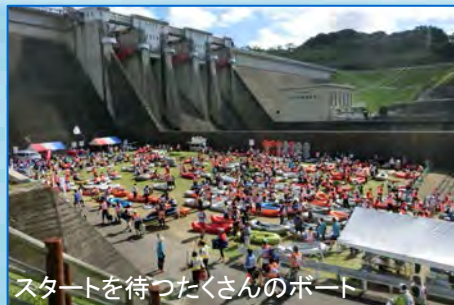
スタートを待つ皆さんのボート