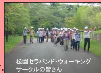
松園セラバンド・ウォーキングサークルの皆さん

四十四田ダムの近くに住んでいても、なかなか立ち寄ることがなかった、というお話もあり、今回の見学で、四十四田ダムを身近に感じていただけたのではないかと思います。