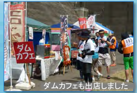
ダムカフェも出店しました