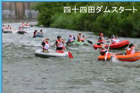
四十四田ダムスタート

水しぶきを浴びながら、他の皆さんも楽しそうに川下りを楽しんでいました。橋上や河川敷には多くの方がかけつけ、温かい声援で選手を元気づけ、大会を盛り上げました。