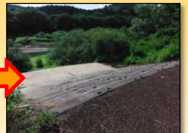
繁茂した樹木を伐採し、安全を確保