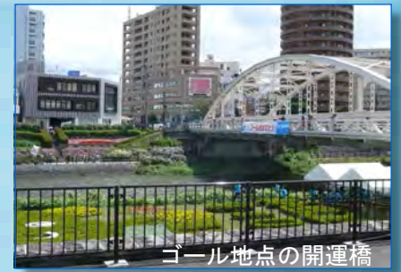
ゴール地点の開運橋

また、今年は岩手国体の年です。閉会式には、大会参加者が見守るなか、炬火の(聖火)の採火式も行われ、岩手国体へバトンを繋ぐ、記念すべき大会となりました。