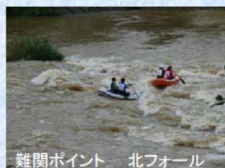
難関ポイント 北フォール