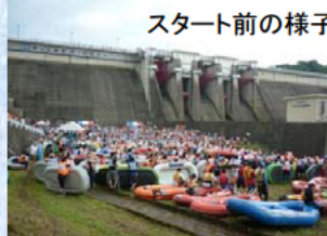
スタート前の様子