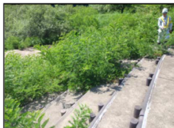
水辺の階段に樹木繁茂 (この後、伐採しました)

7月10日(金)、夏休み前の安全利用点検を実施しました。利用が多くなる夏休みを前に、柳平水辺公園、松園水辺公園、四十四田公園の3箇所を点検し、危険な箇所がないか点検を行いました。危険な箇所については、対応を実施済みです。