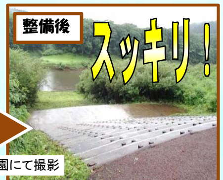
柳平水辺公園にて撮影

危険箇所の対策はしてありますが、利用者の心掛けが何より大切です。安全に気を付けながら楽しい夏を過ごしましょう。