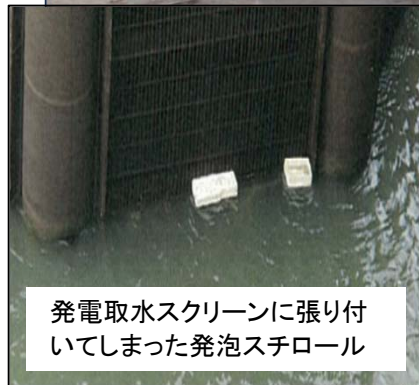
発電取水スクリーンに張り付いてしまった発泡スチロール