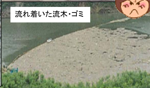
流れ着いた流木・ゴミ