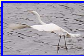
飛び去ろうと羽根を 広げた瞬間！