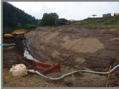
今年度分の 完成写真 10月撮影