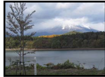
『松園十景 晩秋の四十四田』