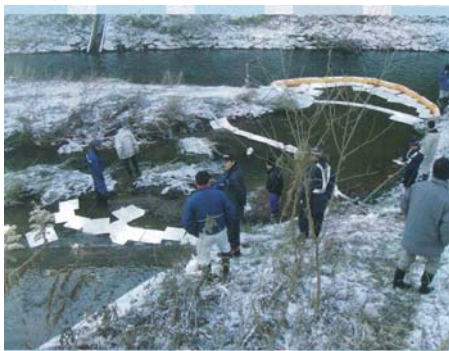
↑ 油回収作業の様子