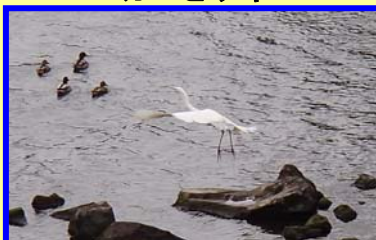
こちらは白いサギ