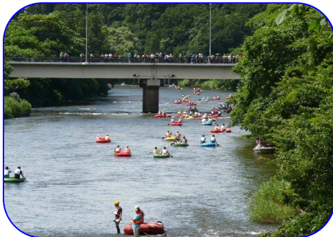
たくさんの方が応援しました