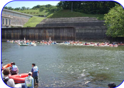
タイムレース部門 1組目スタート!