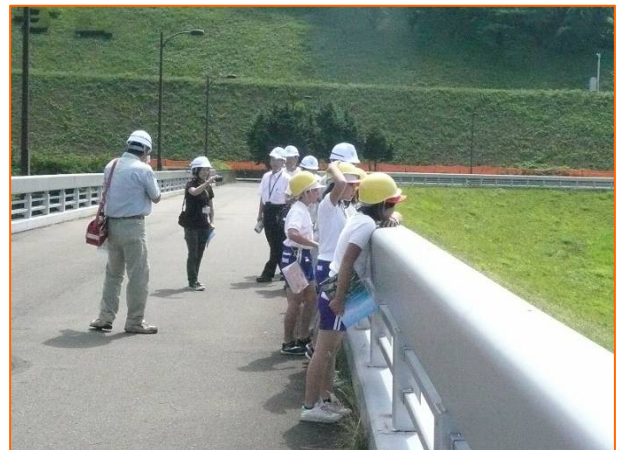
ダム上部からの高さに驚いた様子