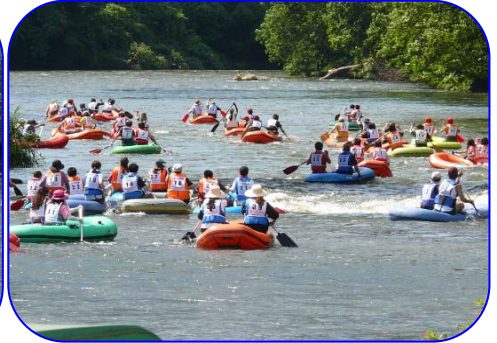
四十四田橋付近から撮影