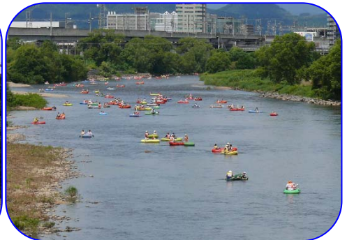
最終地点手前 明治橋付近