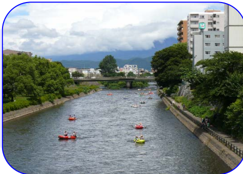
ゴール間近の旭橋付近