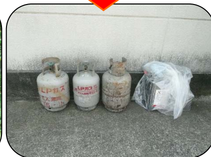
回収したガスボンベなど