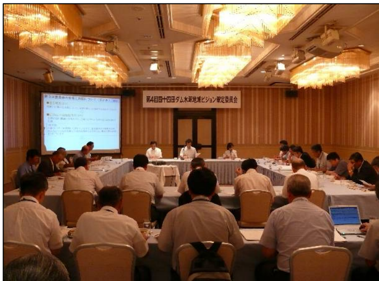
策定委員会の様子

今回の委員会では、前回委員会の内容確認と今後のビジョン推進方法についての最終確認を行いました。今委員会で、四十四田ダム水源地域ビジョンは策定され、今後は推進協議会を立ち上げ水源地域の活性化を図っていきます。