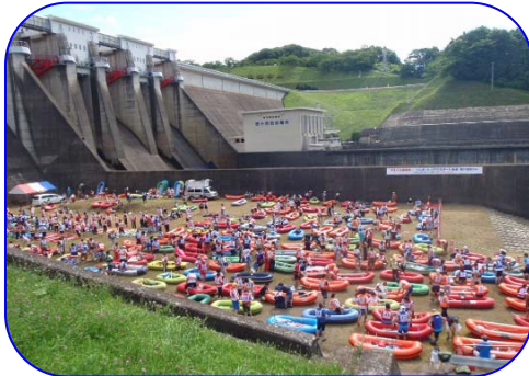
色とりどりのゴムボートが並んでいます

大会前週には台風接近も心配され、また前日には東日本大震災の余震とみられる強い地震もあり開催が心配されましたが、当日は天気もよく川下りには絶好の日となりました。