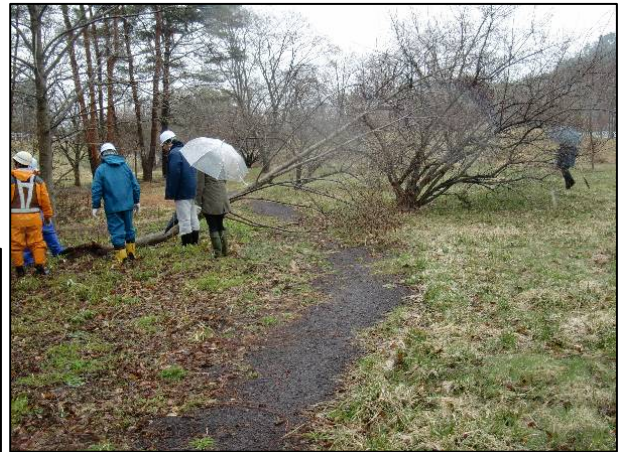
倒木や枝折れが多くみられました