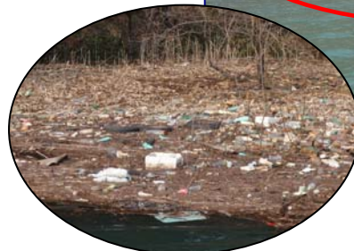
たくさんのゴミが漂着し、水質や環境悪化が懸念されます。