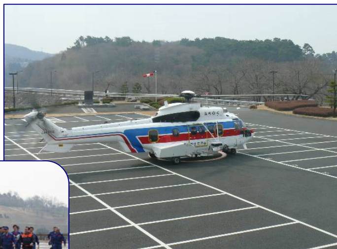
H23.4.16 ヘリが着陸しました