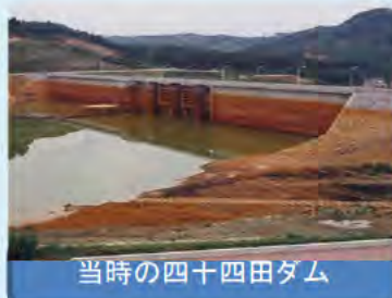
当時の四十四田ダム

四十四田ダムが完成した当時は、鉄分を含んだ旧松尾鉱山廃水がダムに流れ込み、ダム本体も赤色に染まっていた。その後、昭和56年に新中和処理施設が完成し、清らかな流れを取り戻しています。