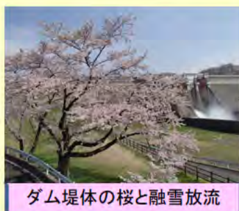
ダム堤体の桜と融雪放流