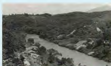
昭和36年9月のダム地点

四十四田ダムが建設される当時の写真と完成した頃のの写真です。地域の方々のご協力により、この地に四十四田ダムが建設されました。