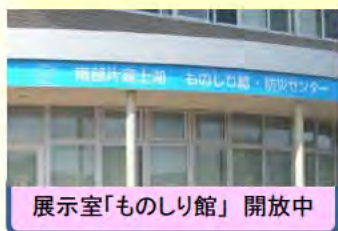
展示室「ものしり館」開放中