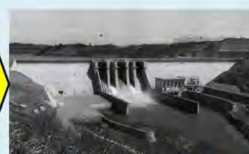
昭和43年4月のダム地点