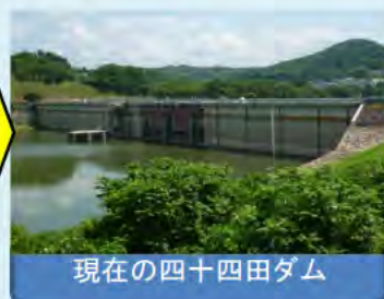
現在の四十四田ダム