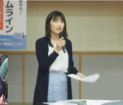
お天気キャスターによる解説