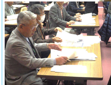
マイ・タイムライン作成の様子