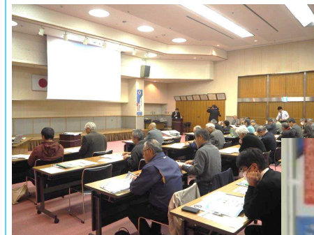
講習会会場の様子