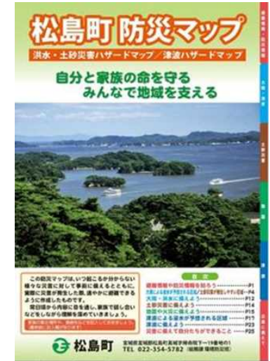
想定最大規模降雨量「浸水想定区域」を反映