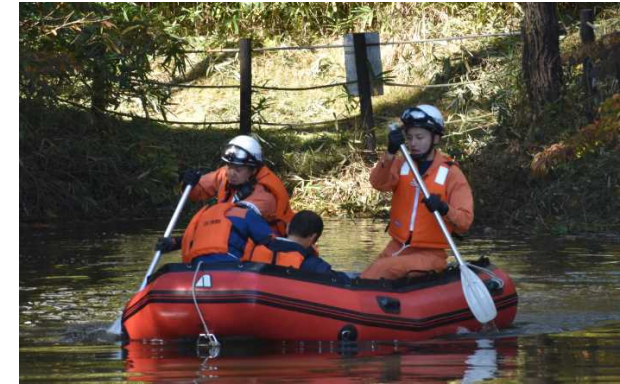
浸水被害救助訓練

※避難所開設訓練では「避難行動要支援者名簿」を活用し、安否確認（避難誘導）対象者等の確認を行っている。