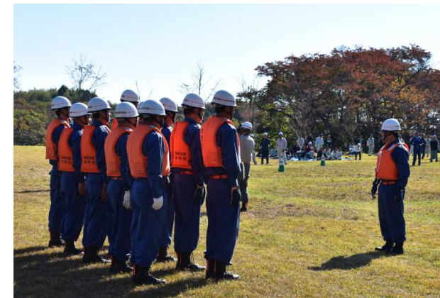
消防団による水防工法訓練