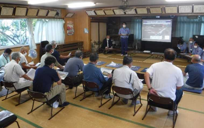
第二部：事務所長挨拶