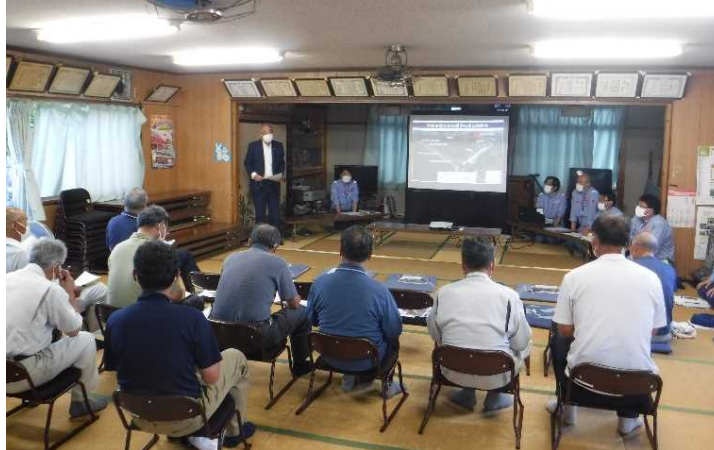
第二部：大和町長挨拶