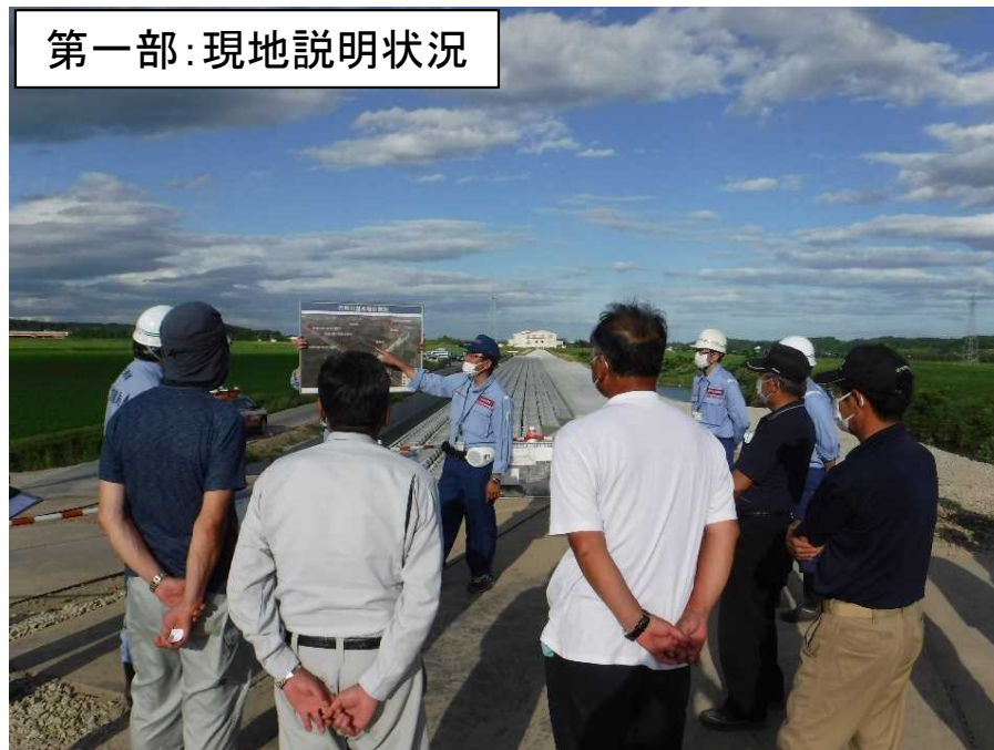
第一部：現地説明状況