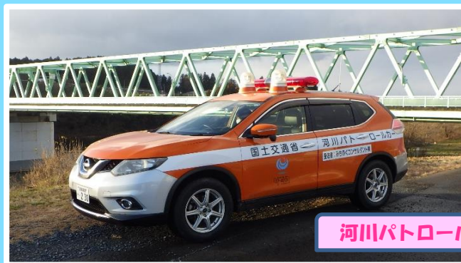
河川パトロールカー