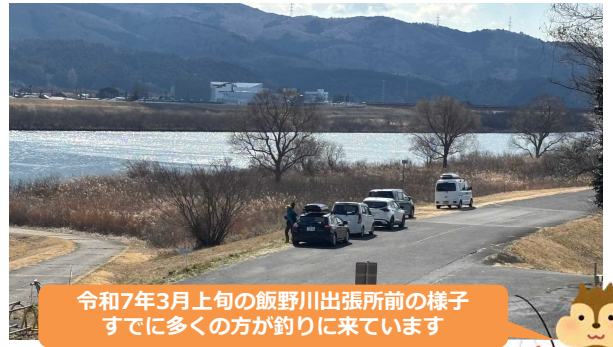
令和7年3月上旬の飯野川出張所前の様子 すでに多くの方が釣りに来ています