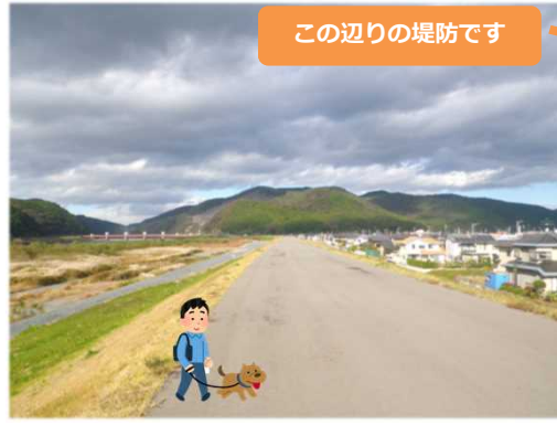
この辺りの堤防です

北上川左岸のビッグバンの裏から北上大堰までの堤防は一直線で道幅が広く、北上川の流れを一望できて眺めも良いため、犬の散歩やウォーキング等で多くの方が利用しています。犬の散歩やレジャーなどで堤防を利用する際は、 犬のフンはそのままとせず、必ず回収して下さい。 また、 弁当や飲み物のゴミ等は忘れずに持ち帰りましょう。