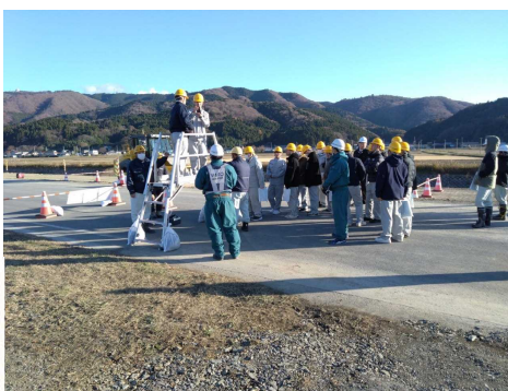
▲AR（拡張現実）実体験の様子