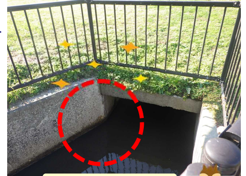
きれいになったね！