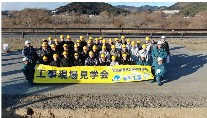
▲最後にみんなで記念撮影です！