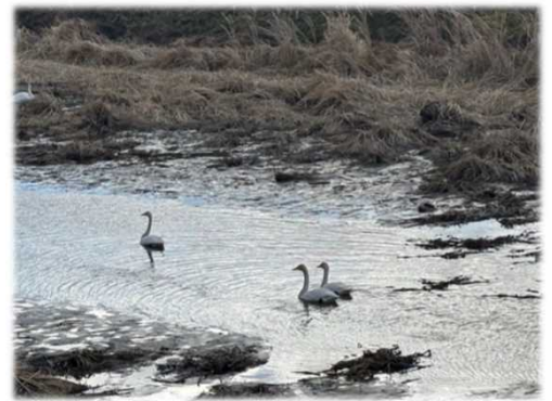
この川は北上川沿いを流れる皿貝川です。ここで多くの鳥たちが一休みしています。

渡り鳥たちを観察できるのは3月頃迄です。よく晴れた冬の日、渡り鳥たちに会いに北上川沿いをドライブしてみたいいかがでしょうか。