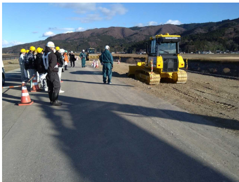
▲ICT建設機器稼働状況の確認