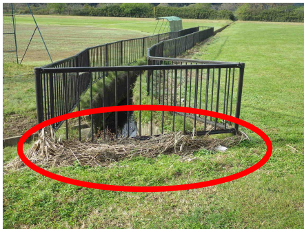
【転落防護柵に流れ着いた塵芥を撤去】 撤去前 ◀ ▶ 撤去後