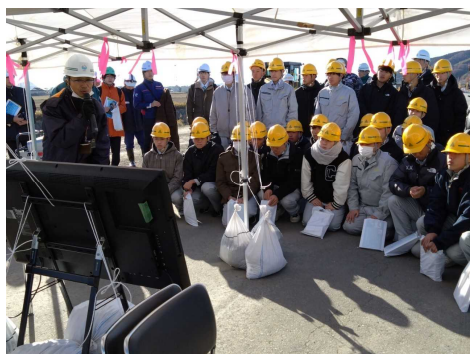
▲3次元データ紹介の様子

参加した皆さんは、石巻工業高等学校（土木システム科2学年）40名及び東北地方整備局若手職員8名の総勢48名です。見学会は、①3次元データの紹介、②3次元データを活用した（ICT建設機械・デジタルツール・測量器械（杭ナビ）・AR）の紹介、③車両運行管理シミュレーションの紹介、④ドローンによる集合写真撮影、の順に行われ、皆さん興味深げな面持ちで、真剣に受講していました。