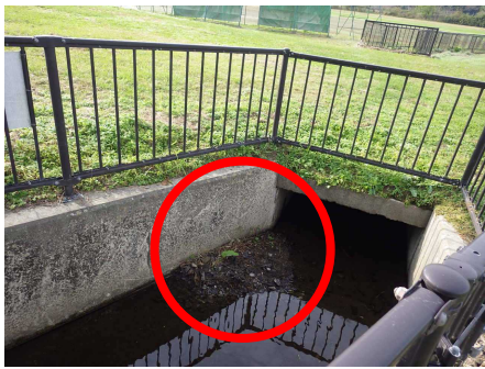
【場外水路に溜まった土砂を撤去】 撤去前 ◀ ▶ 撤去後

11月13日(水)、宮下排水樋管において堤外水路に溜まった土砂や、出水により転落防護柵に流れ着いた塵芥を撤去しました。この撤去作業により、排水路内の水の流れがスムーズになり、詰まりによる機能不全を防ぐことができます。