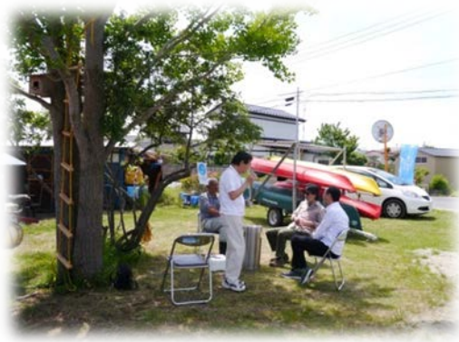
木陰でご近所達さんが談笑中