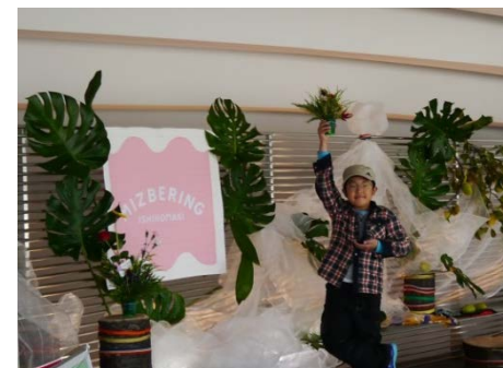
ミズベリングマークと一緒に 記念撮影