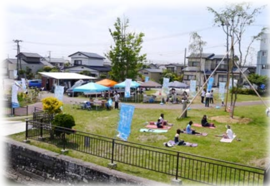
普段静かな石井閘門周辺も賑やかに

平成28年5月29日、初夏の爽やかな天候の中、旧北上川石井閘門周辺にて「みずべマルシェin北上川」を開催しました。今年は新たにヨガブースを設けて、ヒーリング音楽の生演奏とともにヨガを行いました。その他、カフェ・フリーマーケット・カヌーのブースも出店して、ご近所の方々をはじめとする多くの方々にミズベの心地良い空間でゆっくりと流れる時間をお過ごし頂きました。着実に地域へ根付き始めたイベントとなっていることを実感いたしました。