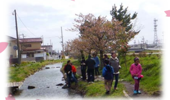
一瞬の晴れ間に近くの小川でお花を植栽