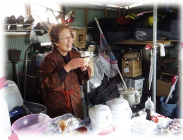
お師匠さんによる茶道のイロハ