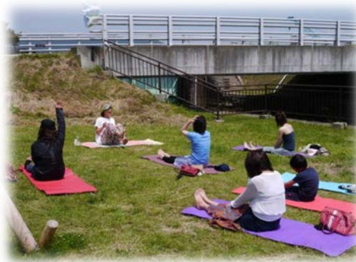
女性に大好評だったヨガブース