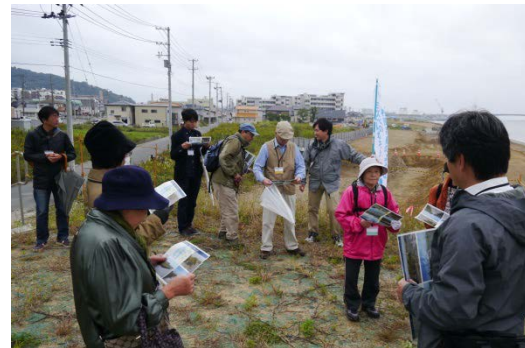
堤防天端から整備後の高さを体感