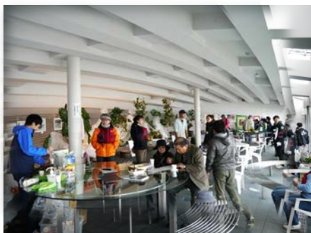
地元の方々の来場で賑やかに

当日は、地元の方々を中心に60名程度の来場者があり、石井閘門のサクラと再会や様々な展示物を鑑賞して“ちょっとアートな空間”を楽しんでいただけただけです。