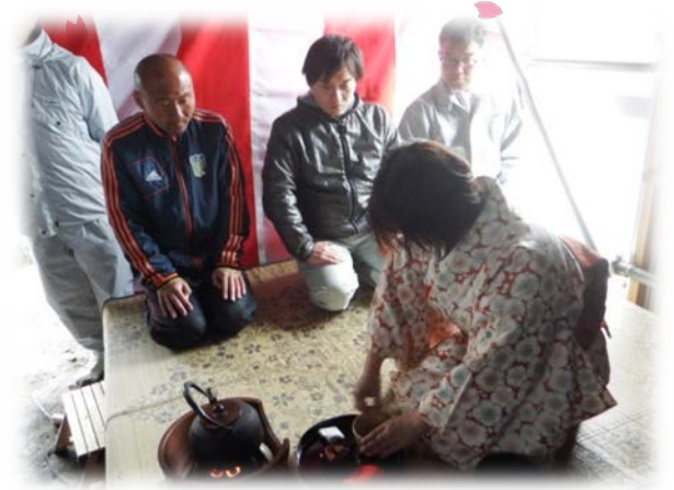
やや緊張気味で茶道を体験中です。