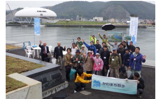
カフェブースを設けて堤防整備状況を説明