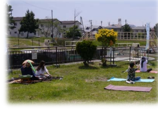
ヒーリング音楽の生演奏とヨガ+ミズベの効果で心も身体もリフレッシュ!