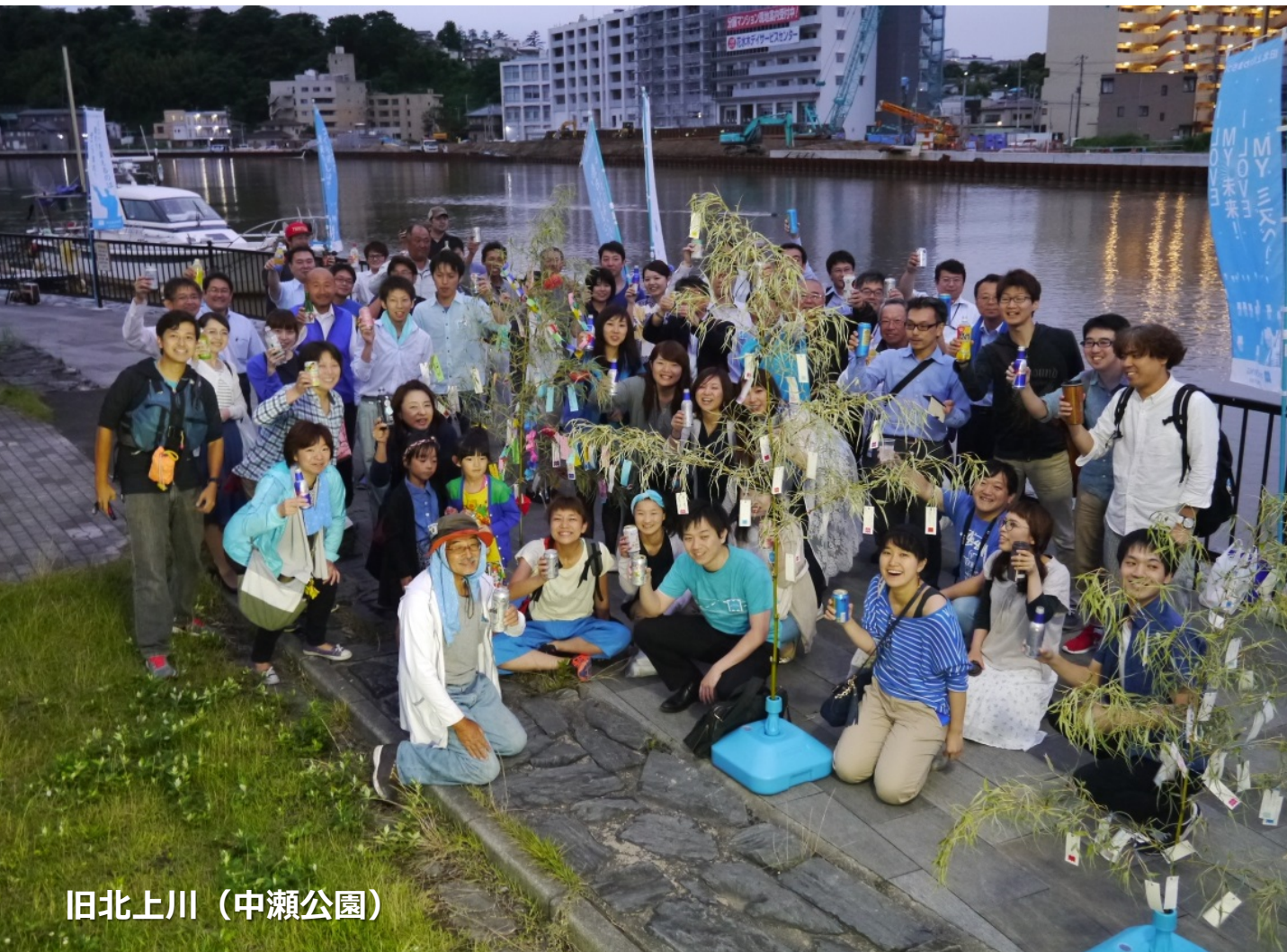
旧北上川（中瀬公園）