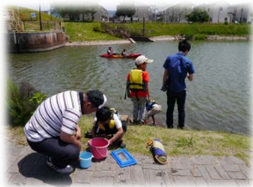
子どもたちはカニ取に夢中