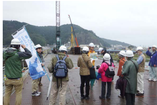
仮設用栈橋より、施工中の新内海橋を見学