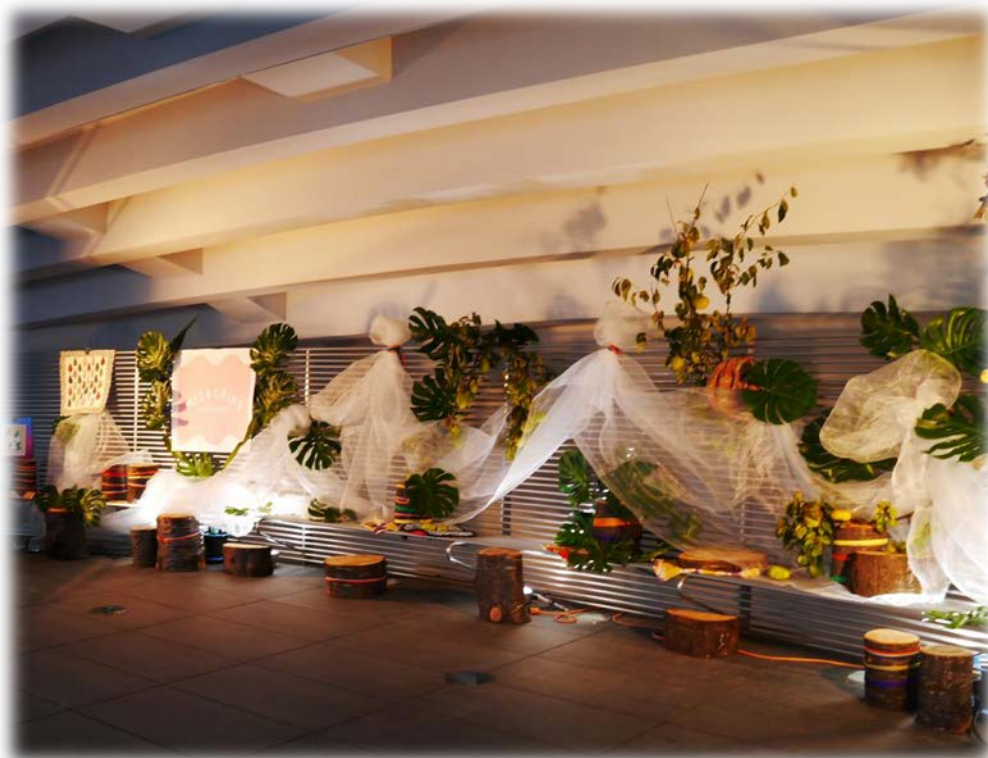
石井閘門のサクラもお色直しして地元の方々と再会。