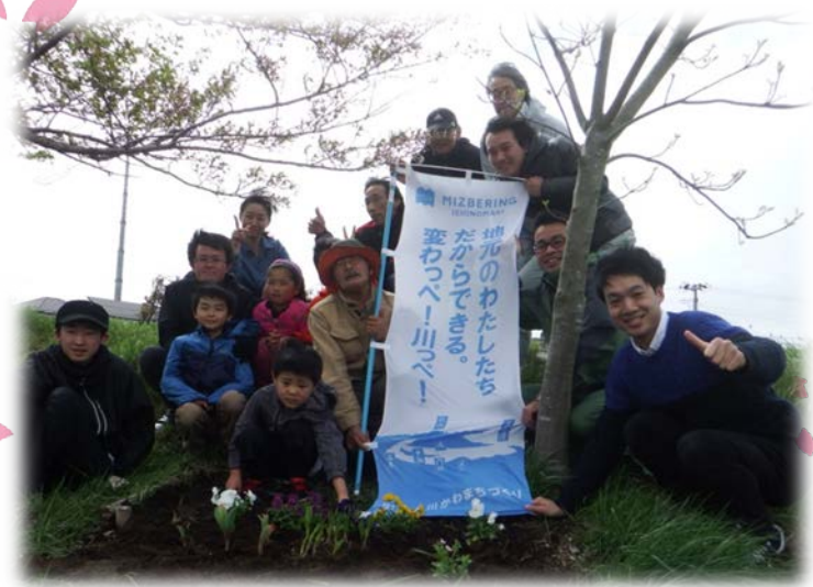
みんなで記念撮影