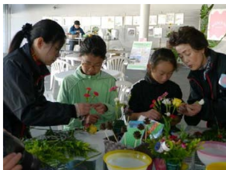
華道の技を伝授されてた “こどもいけばな教室”