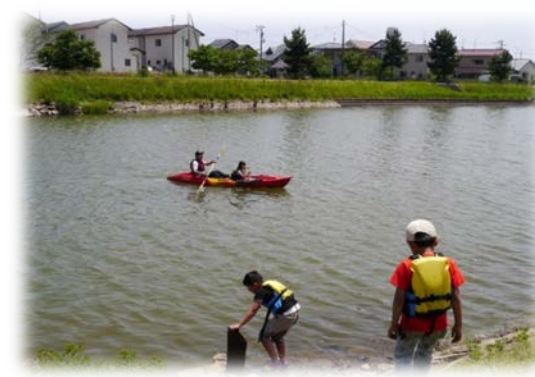
晴天の中でカヌーも親子連れに人気