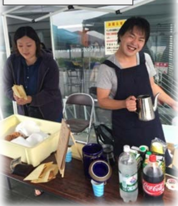
体験ブース(カヌー、DJ、木工体験等)