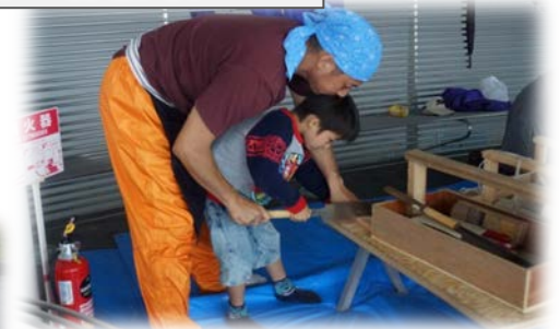
体験は子どもたちに大好評