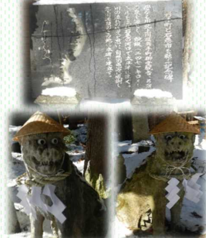
狛犬も笠を被って参拝者をお出迎え なんとも愛らしい表情ですね

～巡視員のおすすめ！～ 巡視の際に撮影した季節を感じる写真を紹介します☆ よちよち歩き可愛いオオハクチョウ♪川辺で羽を休めています