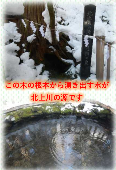
この木の根本から湧き出す水が 北上川の源です