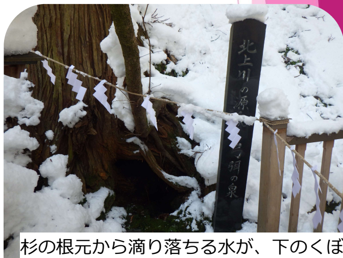
杉の根元から滴り落ちる水が、下のくぼみに貯まり、この泉からあふれた水が流れ出て北上川の源流になります。