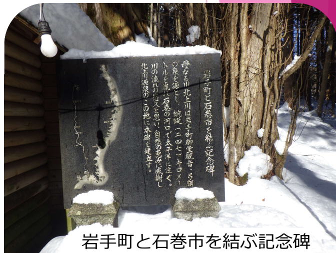
岩手町と石巻市を結ぶ記念碑

今年も何事も無い事を祈りたいですが、地震・火山災害のほか、大規模洪水などの発生に備えて気象情報・災害情報の入手先や避難経路を確認してご自分やご家族の身を守るように日頃からの心構えをしておくことが重要かと思っております。最後に、今年もどうぞよろしく願いいたします。