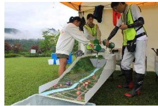
ダム効果模型実験