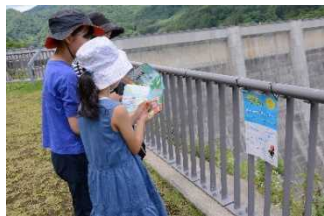
津軽ダムクイズラリー