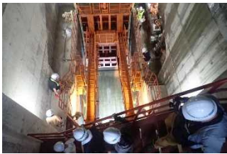
ダム堤体・発電所見学ツアー