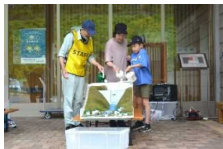
ダム効果模型実験