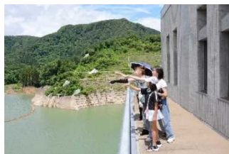
紙ヒコーキ飛ばし