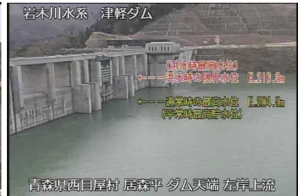
▲ダム湖の状況 (R6.04.16現在)