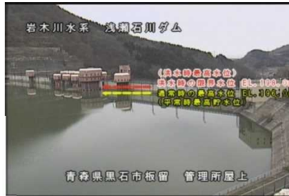
▲ダム湖の状況 (R6.04.16現在)