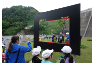
▲ダムカード風フォトフレーム