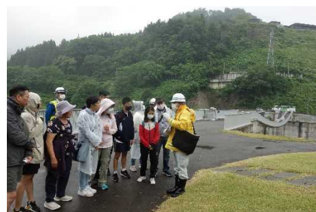
▲外国からのお客様もいらっしゃいました