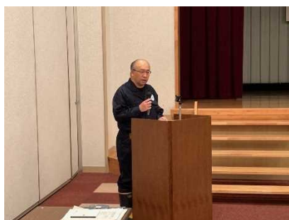
▲弘前労働基準監督署 署長による講話