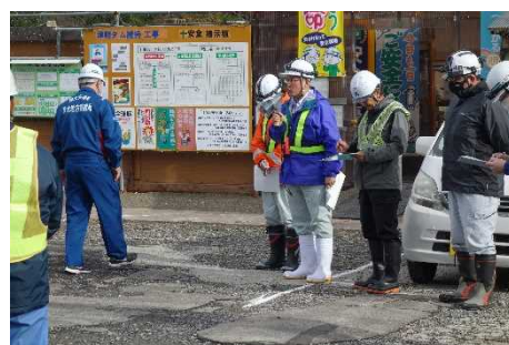
▲点検後の意見交換