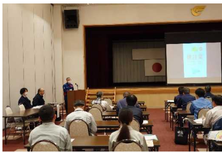
▲当事務所長による挨拶