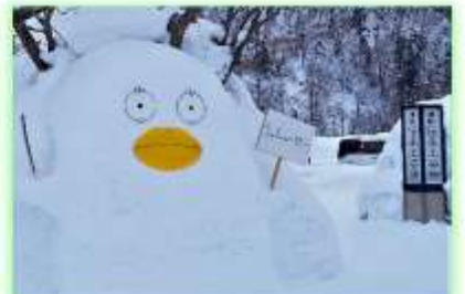
▲何のアニメのキャラクターかを当てながら進んでも楽しいです