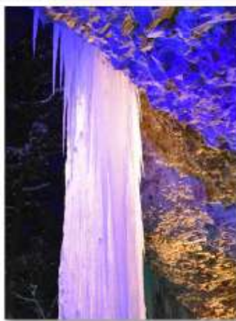
▲青く照らされた岩肌も神秘的