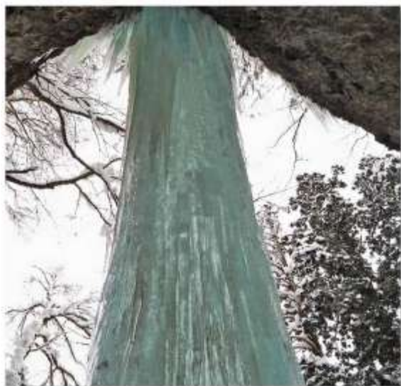
▲結氷した乳穂ヶ滝を裏側から撮影。氷柱が幾重にも重なる様子がわかる