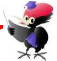
津軽ダムイメージキャラクター ペッカー君