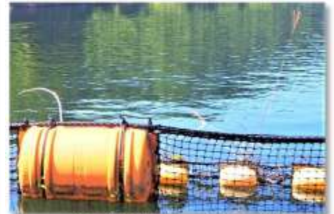
▲実際に流木等がキャッチされた時の様子