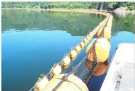
▲フローティングネットと集積網場と、網が重になっています

A.網場(あば)ペカよ！オレンジの浮き(フロート)の下には網がついていて、上流からの流木等が堤体や取水設備にぶつかってダム管理に支障がでることのないように、キャッチします。