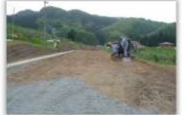
▲2005年6月の付替県道工事の様子

A.1620億円ペカ！ダムの建設に使う重機等が通れるように、バイパスする工事や県道を広げる工事もしたんだよ！