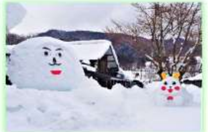
▲大きな雪像は削り出した後に雪を付けたりと製作工程も複雑なよう