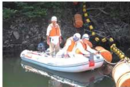
▲ダム湖上で網場の点検を行う様子