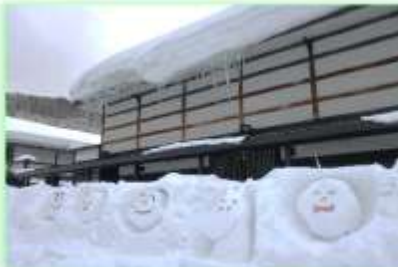
▲雪壁にも数々のキャラクターが刻まれています