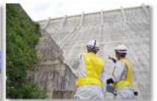
▲下流面を目視で点検する様子