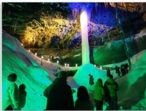
▲連日、貴重な光景を一目見ようという来訪者で賑わっています