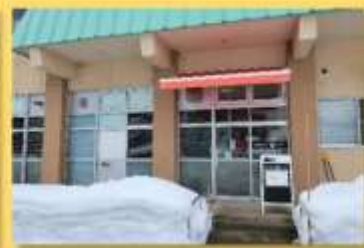
▲ブナコ西目屋工場内にあるカフェの入り口。西目屋小学校の隣です。

※『目屋豆腐』とは 西目屋村伝統の味。昔から砂子瀬・川原平地区の各家庭で作られていた木綿豆腐ですが、津軽ダム建設に伴い移転集落となり一度製造が途絶えながらも、村民の手でレシピが受け継がれ商品化され復活した歴史があります。新パッケージはこぎん柄。