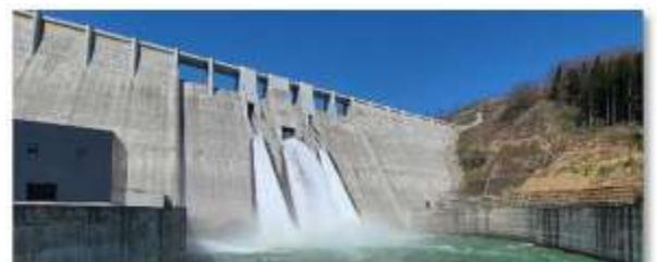
(右)令和3年度点検のためコンジット放流管放水の様子

A.大きな洪水が発生していないので本来目的の『濁り水対策』での放流はしたことはありません。放流設備点検をイベント時に合わせて実施したことはあるペカ！