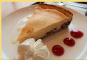
▲『目屋豆腐のチーズケーキ』 中の黒豆も西目屋村産だそうです。ほどよい甘さとココアでリピート間違いなし♪

西目屋村内にあるブナコ西目屋工場内のブナコカフェでは、道の駅津軽白神で販売されている『目屋豆腐』(※)を使った冬季限定西目屋スイーツ『目屋豆腐のチーズケーキ』が提供されています。カフェの厨房で手作りしており、目屋豆腐の販売が終了する5月の連休頃までの販売予定だそうです。