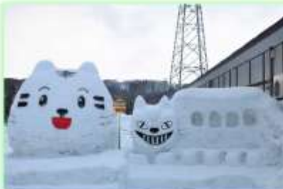
▲現在はバスにだれかが乗っているとかが乗ってないとか？

今回は取材に行った令和4年2月3日(木)の様子をお届けしますが、SNSなどでチェックすると他にもおもしろい雪像が増えているようです。それもそのはず！取材時に雪像を作っていた方も「子供達が喜んでくれることが一番だからね！これからも作っていきます」と話されていました。できる限りメンテナンスをしてくれているそうなので、一度訪れてみてはいかがでしょうか？