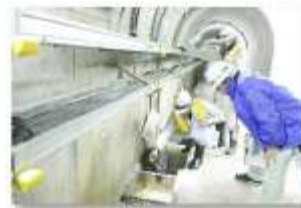
▲漏水量のチェック

A.ダムの中の点検は、週に1回全部歩いて点検します。ダム湖やその周辺も、週に1回船を出して目視で点検、さらに週に1回、外側についている階段を歩いて点検したりなどと毎日点検をしているんだペカ！