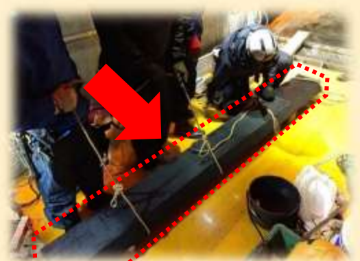
↑ 交換する水密ゴムの1つで、長さが2.8m 重さがなんと100kgもあります！