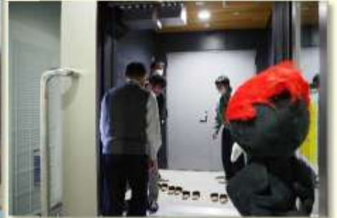
▲渡り廊下から入るペカ！ドキドキ♪ (左写真の①から②へ渡ります)

今回は、引き渡し前の増築庁舎の中に特別に入れてもらいました。ペッカー君5歳の 大冒険が始まります！