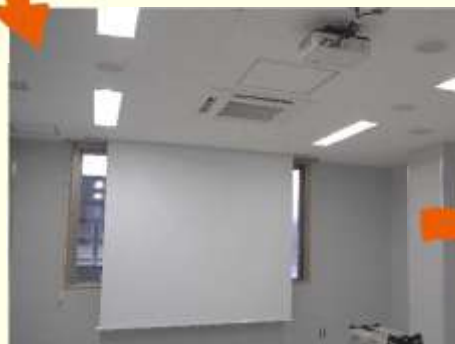
▲プロジェクターとスクリーン!ここ で新しい企画も生まれるかなあ?