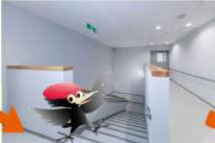
▲階段で1階に向かうペカ～