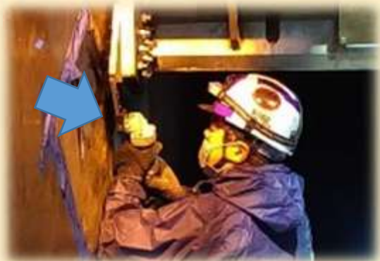
↑ 新しい水密ゴムを付けて終わり！ではなく工具で少しずつ削りながら厚さや長さを微調整していきます。