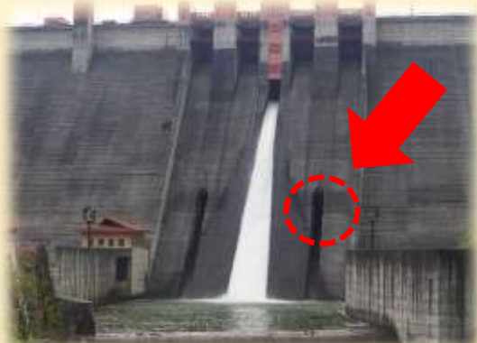
↑ 部品交換したコンジットゲートはココ！洪水時に水を流す大切な設備です。