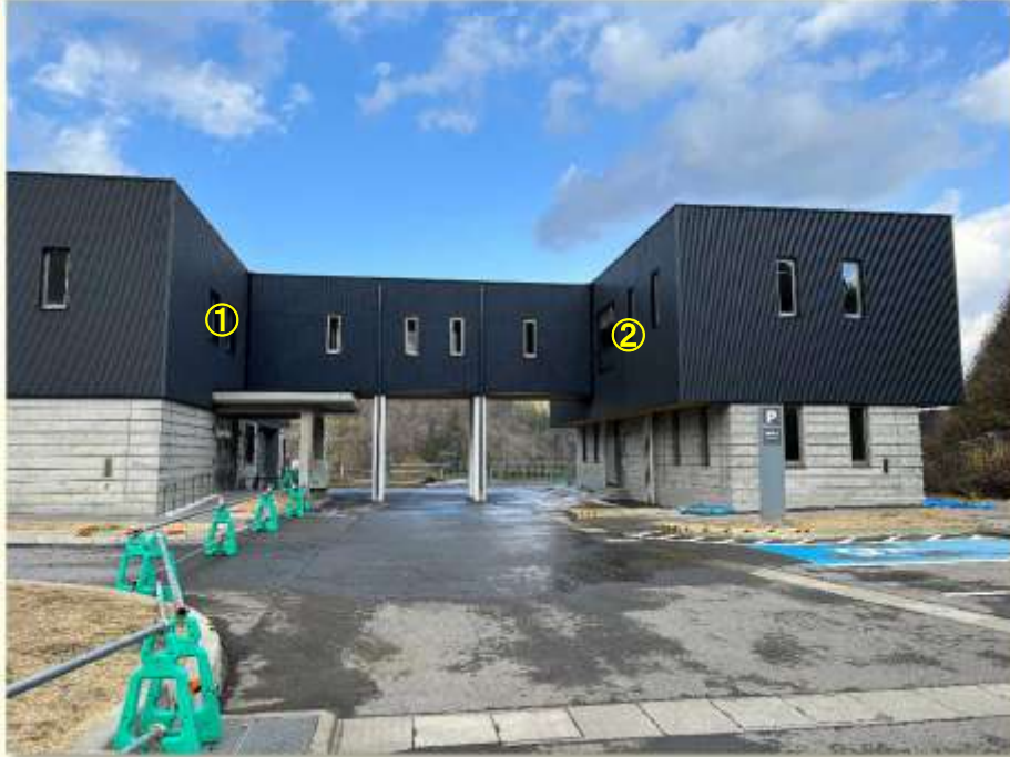
▲概ね完成した増築部分(向かって右側)

今回は、引き渡し前の増築庁舎の中に特別に入れてもらいました。ペッカー君5歳の 大冒険が始まります！