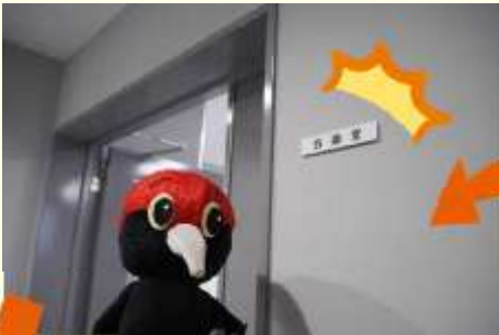
▲会議室の札がついているペカ!!