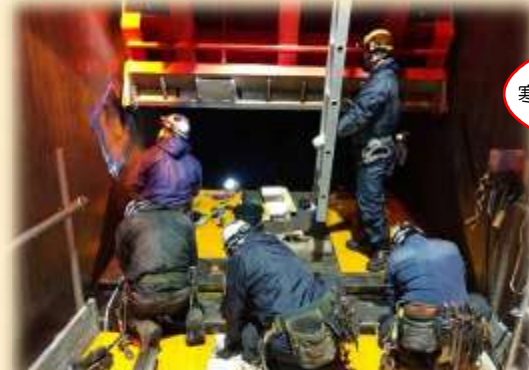
↑ 放流口（水が流れるところ）まで梯子で降りて4～5人で作業を行いました！