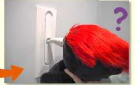
▲一階に来たよ!これはなんだ ろ..ポチっ!わ～窓が開い ちゃった

ペッカー君は今回、会議室から物置まで全て探検しまし た!最後は、排煙装置をくちばしで押ししてしまいましたが、 これは火災時に煙から身を守る大切な設備です。 現庁舎同様、増築庁舎も大事に使用して参ります。