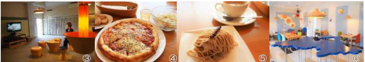
③旧視聴覚室で、スピーカーやスツールを体験④西目屋ハニーピザは、胡椒が効いていて美味⑤和菓子のモンブランにも西目屋産ハチミツ!⑥カフェはブナコ製品がたくさん。彩りもカワイイ