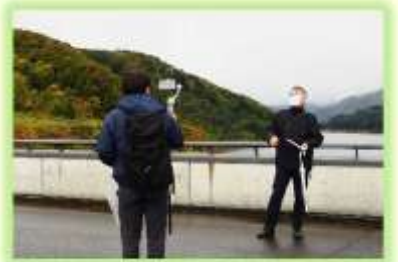
▲津軽白神湖をバックに中継がスタート!