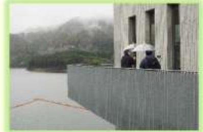
▲取水塔周りを一周しながら、目屋ダム時代からの歴史についてもご紹介いただきました