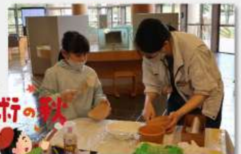
▲形が出来上がったら、内側に刷毛で糊を塗ります。こちらでの作業はここで終了