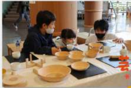
▲制作途中で高さが均一になっているか、専用の台に乗せて確認します。真剣そのもの