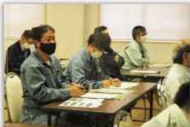
▲検討会の様子。現場代理人よりパトロールで撮影された写真について説明等を行いました