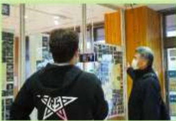
←資料展示室にてダムカードの紹介。ツアー最後にクイズがあり、正解者1名に津軽ダムカードをプレゼントしました