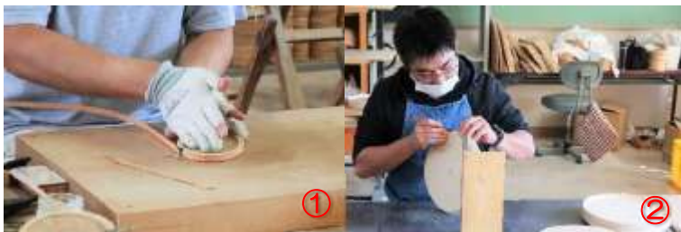
①ブナコの名前の由来。ブナのテープをコイル状に巻きます ②成形作業。高さなどを微調整しています

令和3年11月1日(月)、ブナコ西目屋工場見学とブナコカフェへ行ってきました。場所は津軽ダムから車で10分、西目屋小学校旧校舎がそのままブナコ西目屋工場として使用されています。