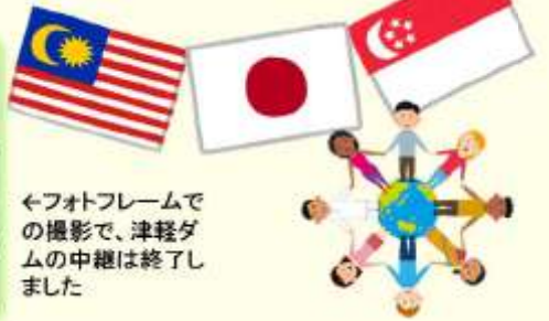
←フォトフレームでの撮影で、津軽ダムの中継は終了しました