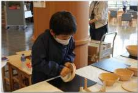
▲左手で器を少しずつずらし、右手に持った湯飲み茶碗を使って力を加え成形します

ふれあいデーでは、色々な新しいことを気軽に体験が出来て大人も子どもも楽しめます。次回開催の際には、是非西目屋村まで足を運んでみてはいかがでしょうか?その際には、ビジターセンターから約7km先の「津軽ダム」にも是非立ち寄ってみてくださいね!