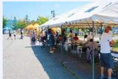
▲屋外に設置されたイベント毎のテント