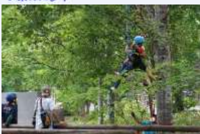
▲毎回人気の木登り体験コーナー