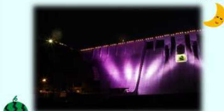
▲ダム上部に小さく三日月が見えました