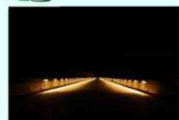
▲漆黒の暗闇に浮かび上がるダム天端のライトアップも一見の価値あり