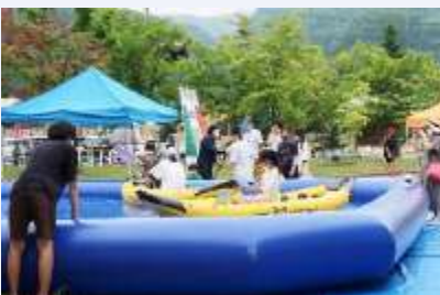
▲パドルスポーツ体験も大盛況！水上アクティビティは涼し気です

3色パステルアート体験コーナーでは、青・赤・黄色のみでこんなに多彩な色が表現出来るなんて！驚きました