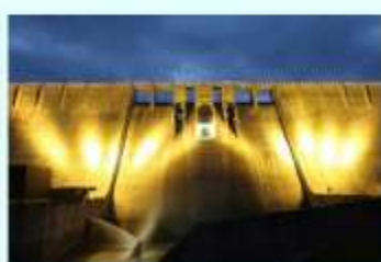
▲花火の投影が終わった直後5分間のイエローはめったに登場しない色。とても美しい！