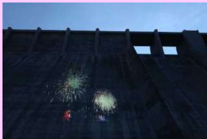
▲ダム堤体に投影した花火