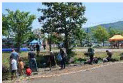
▲水辺では大人も子どもも、オタマジャクシ集めに夢中

令和3年7月24日(土)・25日(日)の2日間で、白神山地ビジターセンター主催の第26回「夏のふれあいデー」が開催されました。イベントの多くは事前募集により人数を限定して行われました。また密にならないよう敷地屋外に設置されたイベント毎のテントは、訪れた多くの家族連れで賑わっていました。