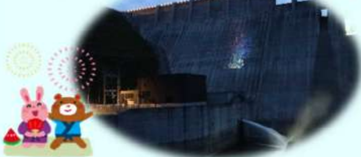
▲下流の白神が故郷橋にて、ダム堤体に投影した花火を臨む