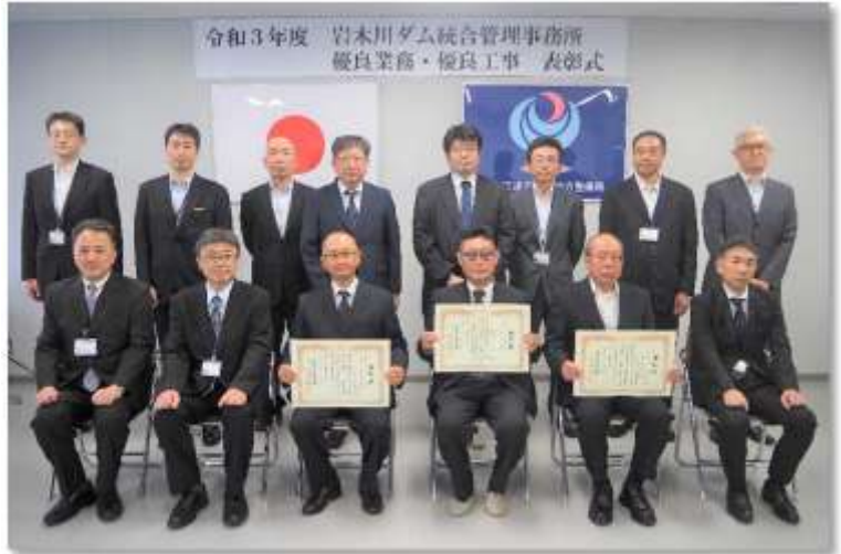
▲賞状を手にした受賞者との記念撮影 受賞者向かって左から 株式会社キタコン様 株式会社村上組様 みちのくコンサルタント株式会社様