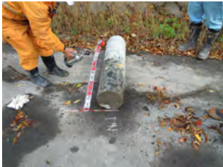
採取されたコンクリート