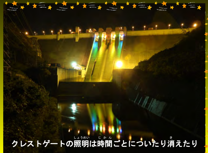
クレストゲートの照明は時間ごとについたり消えたり