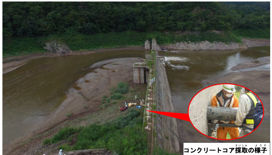
コンクリートコア採取の様子