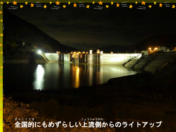
全国的にもめずらしい上流側からのライトアップ

10/13~11/6までダムのライトアップを行いました。ダムの周りに明かりが無いため、暗闇にくっきりとダムが浮かび上がり、とても幻想的な雰囲気でした。