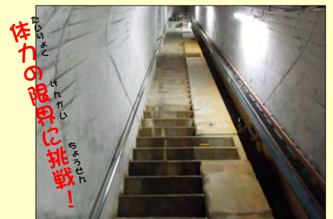
【見学で登る約300段の階段】