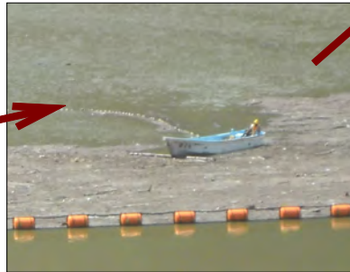
ボートで集めて・・・