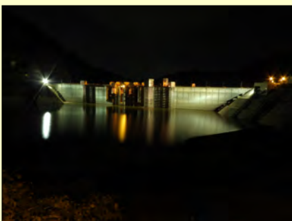
【ダムライトアップ 10/13~11/6】

もみじ山のライトアップ期間に合わせて、ダムのライトアップを行っています。今回は今まで実施していなかった堤体上流面もライトアップしています。ほかには、秋の特別見学会が10月29日(土)に開催されます。今年度3回目となる特別見学会は、ダムの最深部(基礎監査廊)から天端までの約300段の階段(標高差83.4メートル、ビル21階建て相当!)を歩く「健康と挑戦コース」、夜間のダムを見学する「秋の夜長コース」とユニークな見学会となりそうです。ちなみに、冬の特別見学会も予定しております!どんな見学コースになるかは楽しみに~!