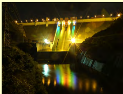
【午後5時から午後9時まで】