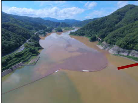
↑ 台風が過ぎ去った後のダム湖。水が濁ってるし、ゴミがいっぱい～！！