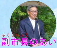
副市長のあいさつ