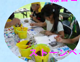
ストーンペイント