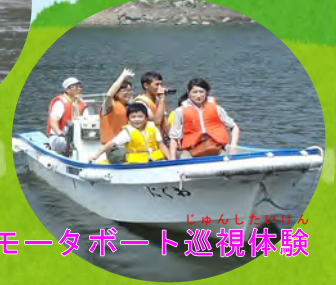
モーターボート巡視体験

7月31日(日)、浅瀬石川ダムで「ダム湖ふれあいデー」が 開催されました。森と湖に親しむ旬間(7月21～31日)の一環 として毎年恒例になっているイベントです。今年もたくさんの家族 連れなどが訪れ、自然に触れながら楽しい思い出を作っていました。