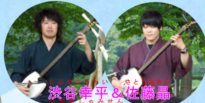
津軽三味線ショー 津軽三味線ショー