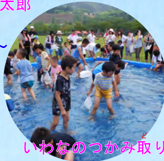
いわたのつかみ取り