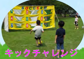
キックチャレンジ