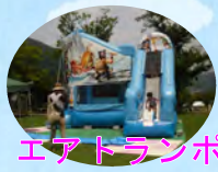
エアトランポリン