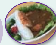
▲津軽ダムカレー ▲目屋豆腐 地元でしか食べられない 冬～春の限定品