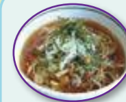
▲白神そばを 使用した山菜そば

100%西目屋村産のそば粉で作られた「白神そば」と「津軽ダムカレー」がおすすめ!!