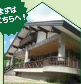
アクアグリーンビレッジ ANMON (暗門の湯)

駐車場から徒歩10分圏内で世界遺産地域に入ることができます。白神山地の情報はここで入手するとよいでしょう。ネイチャーガイドの予約もできます。また、暗門名物「りんごソフト」は絶品です。(7月～11月上旬)