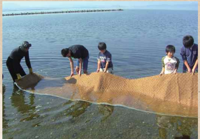
【鳥取県・島根県】中海 NPO法人 未来守りネットワーク

河川協力団体によるアマモ場再生への取り組み。作業に地域の子も達も参加することで、自分達が住む地域への関心や、自然環境に対する意識の向上につながっている。