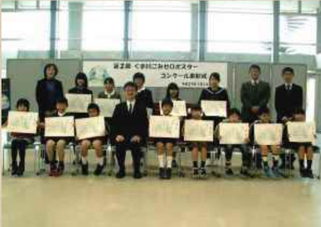
【熊本県】球磨川 次世代のためにがんばろう会

河川協力団体は市民と河川管理者、双方の立場を理解し、活動しています。市民と河川管理者の間に立つことで、お互いの視点や想いを融合することが出来ます。その結果、河川の利活用や維持・管理につながります。