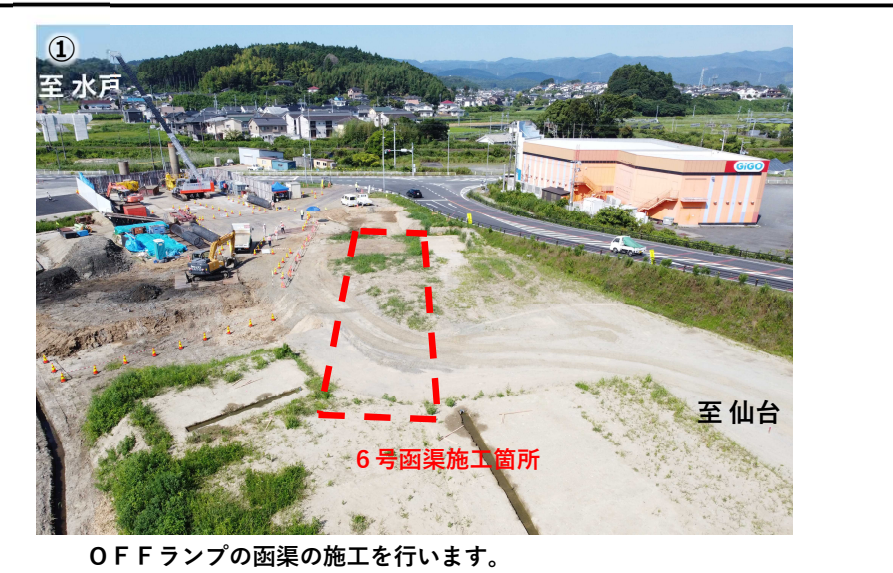
OFFランプの函渠の施工を行います。