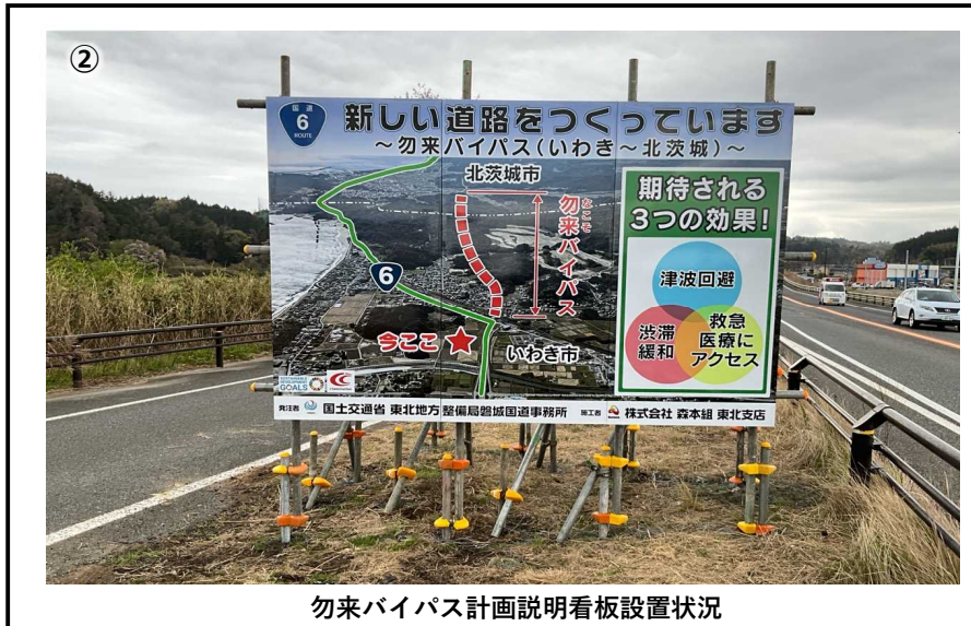
勿来バイパス計画説明看板設置状況