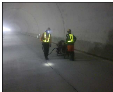
舗装工事起点側 コンクリート舗装 目地工施工状況