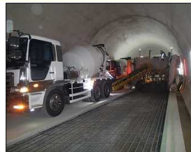
舗装工事終点側 コンクリート舗装 舗装工施工状況