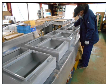
非常警報設備工事 非常電話取納箱製作状況