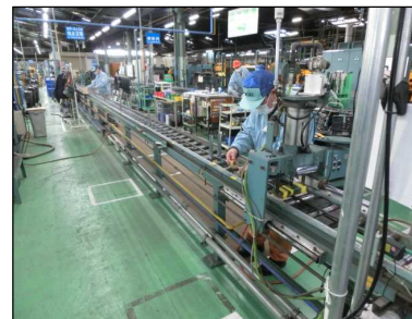
照明設備工事 分岐ケーブル工場製作状況