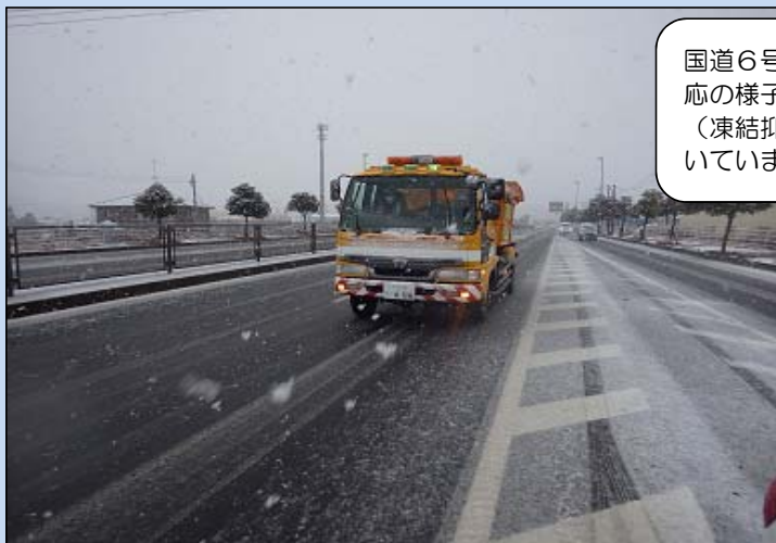
国道6号の降雪対応の様子 （凍結抑制剤を撒いています）