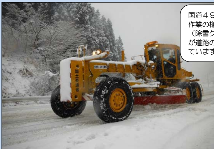
国道49号の除雪作業の様子 （除雪グレーダーが道路の雪を掃いています）

※災害対策基本法第76条の6第1項とは……災害（地震や大雪など）の時に、道路の区間を指定して、その区間内で立ち往生した車両や放置された車両を移動する権限を与えるものです。動けなくなった車両を道路管理者が動かすことができるようになることにより、緊急車両の通行や除雪などを速やかに行うことができますようになります。