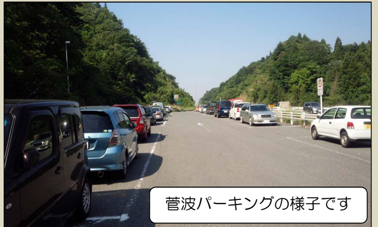
菅波パーキングの様子です

道路の異状「路肩の崩壊」「路面の汚れ（油・土砂）」「路面の穴ほこ」「故障車・落下物」を発見したら... 道路緊急ダイヤル「#9910」へ ご一報をよろしくをお願いします。