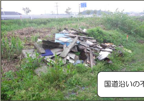
国道沿いの不法投棄の様子です