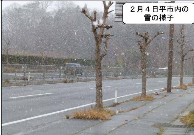
2月4日平市内の雪の様子

平維持出張所では、冬道の通行を守るために道路巡回や補修工事等の道路管理を実施しておりますが、情報板やホームページなどの情報などでも情報提供をしております。冬期の安全対策を万全にお願いします。