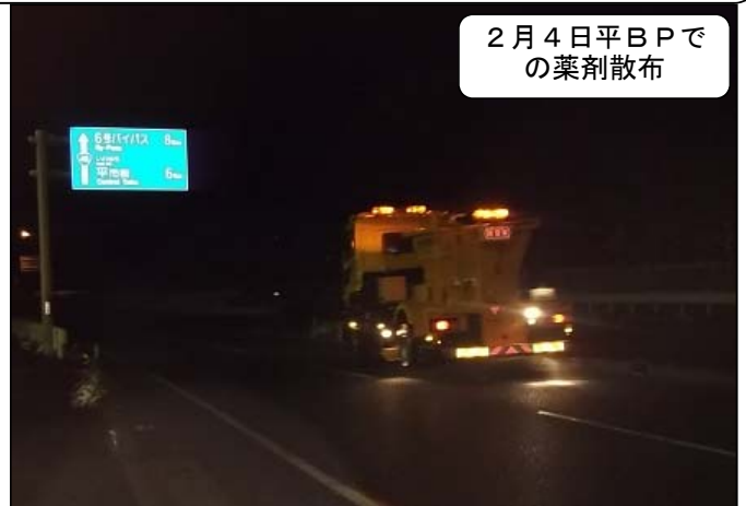
2月4日平B Pでの薬剤散布