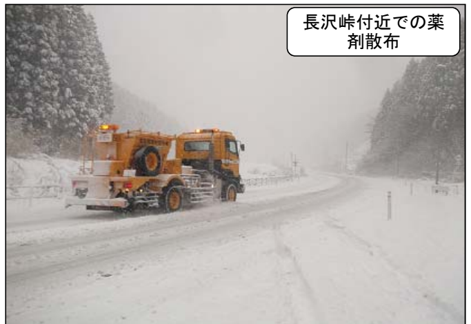
長沢峠付近での薬剤散布

2月4日の雪は、平の市街地では今年初の積雪となりました。「いわきはあまり雪が降らない」と他地域に住む方によく言われますが、年に1～2回程度はこのくらいの積雪があります。