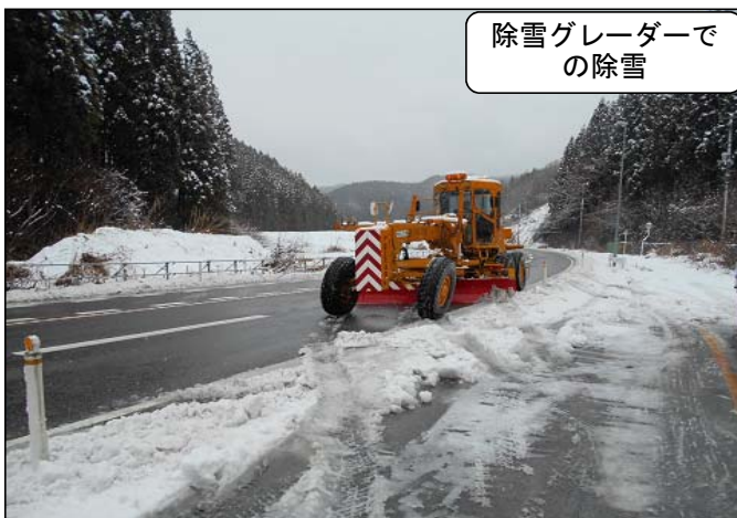
除雪グレーダーでの除雪